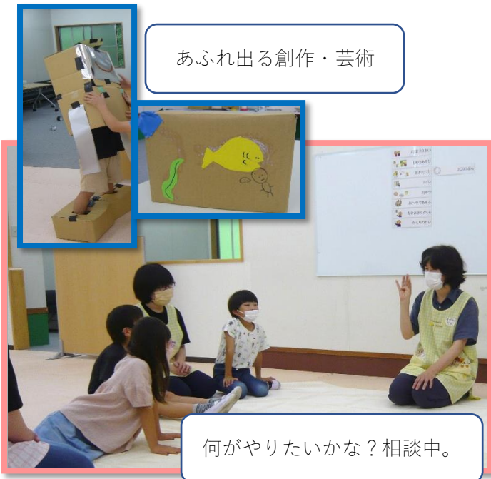
あふれ出る創作・芸術